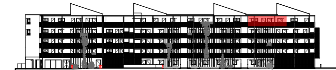
Repérage - Façade Nord :