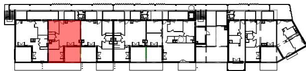
Plan de repérage - R+4 :

Les côtes et surfaces sont mentionnées à titre indicatif et sont susceptibles de variation dans les tolérances du contrat de réservation. Les gaines et les soffites sont mentionnées à titre indicatif et sont susceptibles de légères variations ou créations en fonction d'impératifs techniques ou administratifs. L'emplacement des éléments de cuisine et salles de bain est mentionné à titre indicatif. Les pointillés ne constituent pas du mobilier rentrant dans le cadre de la vente.