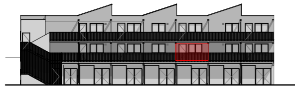
Façade Sud Est