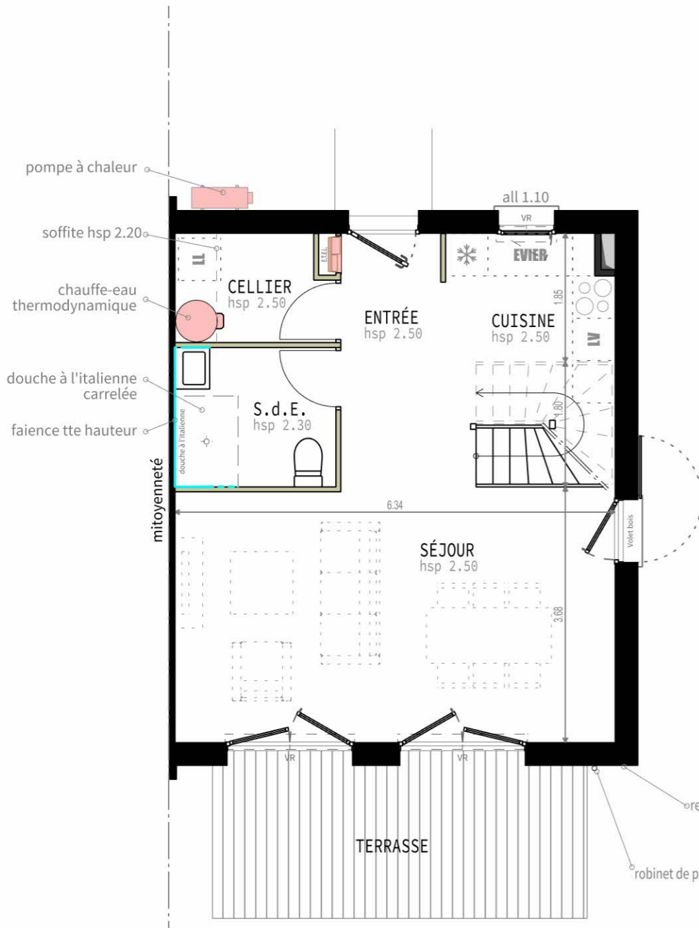
VUE EN PLAN RDC